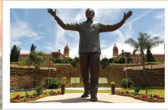
‘n Aangepaste Status Quo