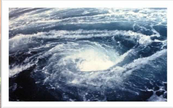
“Grand Rapids and White Waters”