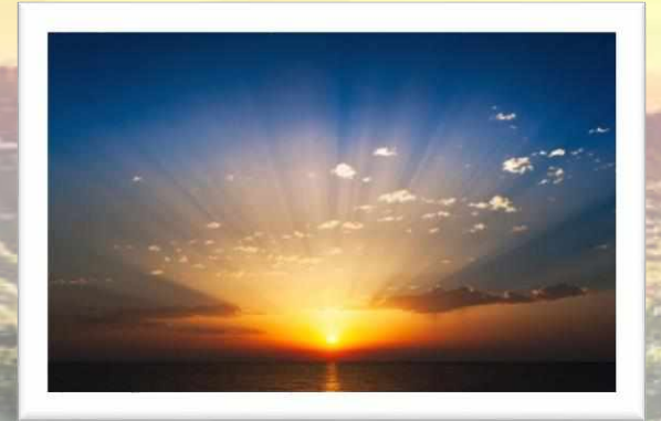
“A New Dawn”